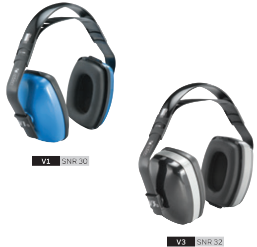
V1 SNR 30