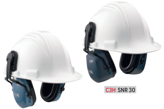
C1H SNR 26