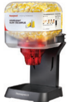
HL400 Lite Frame Lighter design for smaller spaces