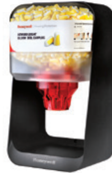
HL400F Full Frame Robust design for high traffic